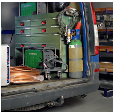
Migatronik Delta jako vybavení servisních vozidel.