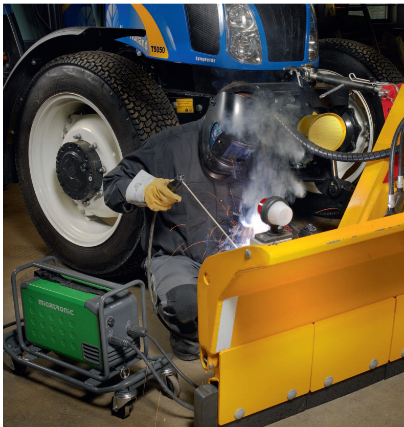
Přenosná Delta může být vybavena i ochranným rámem a podvozkem.