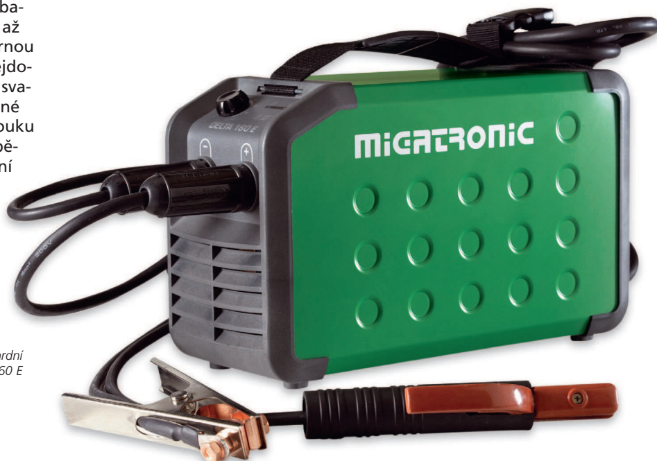
Standardní Delta 160 E

Stroje Delta se vyznačují charakteristickým zaobleným designem Migatronik, malými rozměry, odolnou skříní a nízkým těžištěm, to vše při hmotnosti 6 – 10 kg. Hodí se proto dobře pro použití v dílně i na montážních místech v terénu.